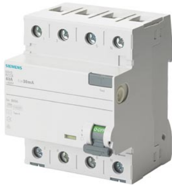
FI-Schutzschalter, 4-polig, Typ A, In: 63 A, 30 mA, Un AC: 400 V