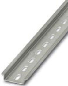
Tragschiene, Material: Stahl, gelocht, Höhe: 7,5 mm, Breite: 35 mm, Länge: 1 m

Bitte beachten Sie, dass die hier angegebenen Daten dem Online-Katalog entnommen sind. Die vollständigen Informationen und Daten entnehmen Sie bitte der Anwenderdokumentation. Es gelten die Allgemeinen Nutzungsbedingungen für Internet-Downloads. ( http://phoenixcontact.de/download )