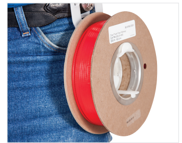
Gürtelclip-Rollenhalterung mit Clear Track-Glasfaserkanalrolle