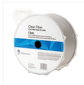
Transparente 900-µm-Glasfaser, 1-km-Spule ITU-T G.657.B3-zertifiziert