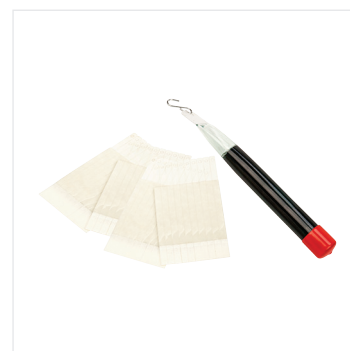
Gewicht und Teststreifen für Wandflächen-Kompatibilitätstest