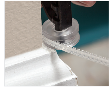
Clear Track-Installationswerkzeug für Innenräume